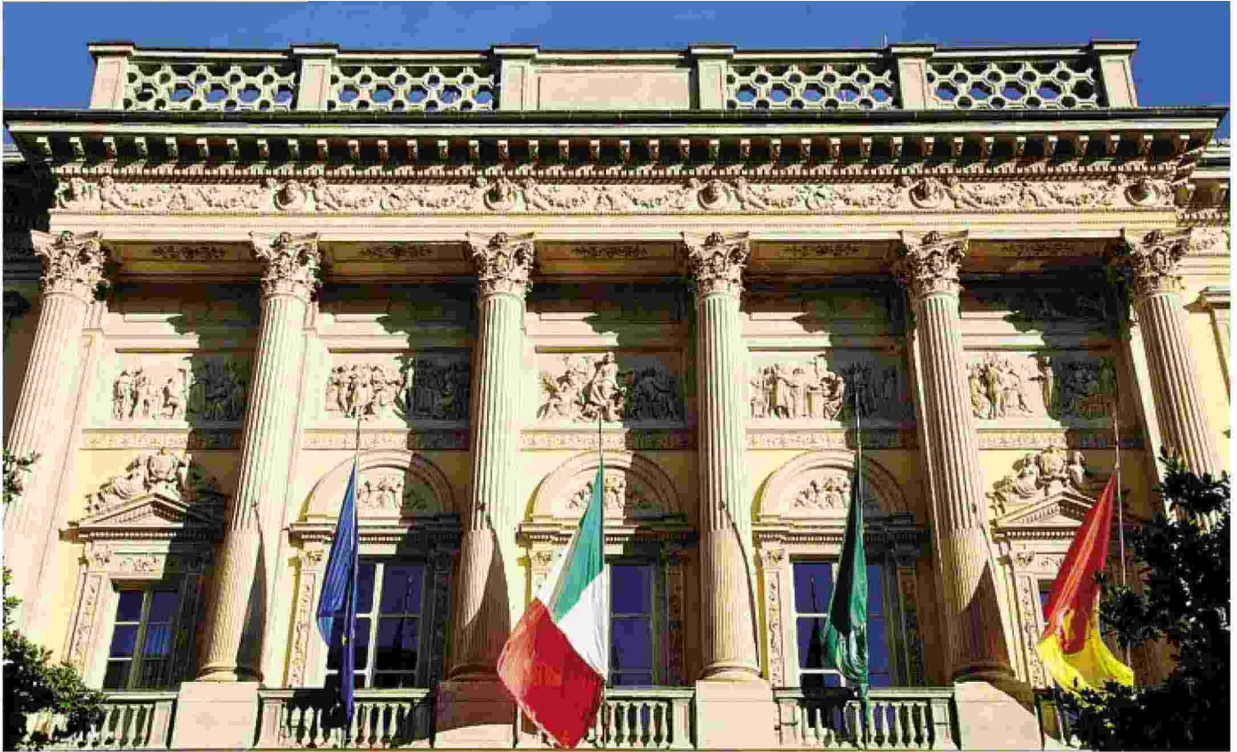
Il palazzo della Provincia: Bergamo è stata scelta per ospitare la due giorni nazionale per ripensare il ruolo degli enti provinciali italiani

■ Rappresentanti istituzionali da tutto il Paese, tra gli ospiti anche il giurista Valerio Onida