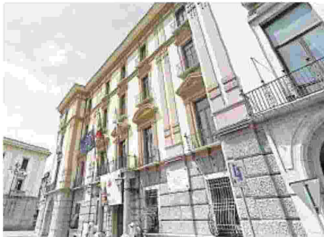
L'ISTITUZIONE Il consiglio provinciale ad Avellino